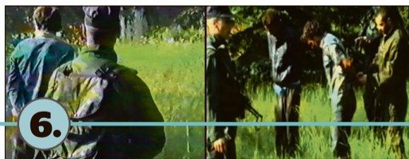
Jedinica srpskog MUP-a "Škorpioni" ubija šest Bošnjaka, muškaraca i dječaka, iz Srebrenice.

Snage bosanskih Srba su pravile zasjede koloni muškaraca i dječaka, da bi potom koristili uhvaćene kao mamce kako bi izvukli vani Bošnjake koji su se krili u šumi. Ove snage su također ukrale opremu od UN-a, uključujući šljemove