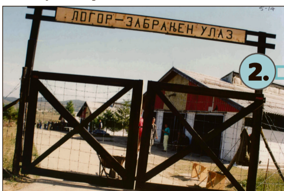
Ulaz u koncentracioni kamp Manjača, gdje je 1992. zatvoreno hiljade Bošnjaka i Hrvata (MKSJ, sudski spisi)

Šest strateških ciljeva smatrani su vjesnikom i uvodom genocida u Srebrenici te je njihova implementacija ubrzo počela.