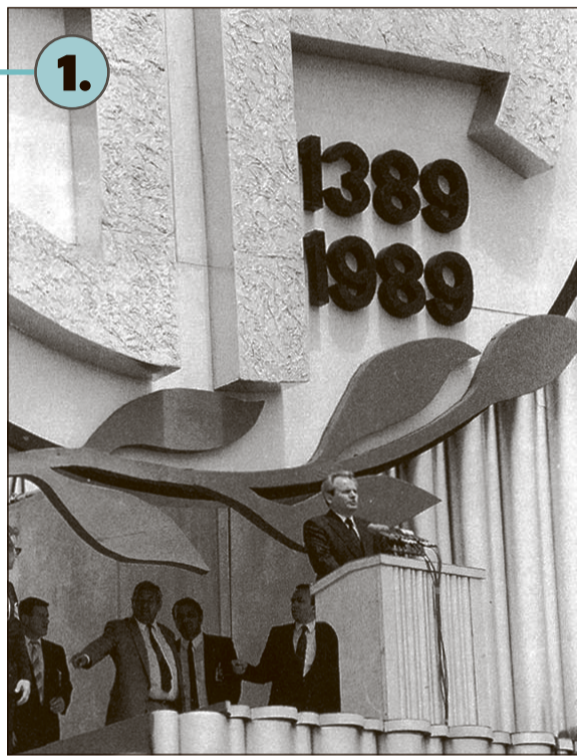
Slobodan Milošević drži govor na Gazimestanu, Kosovo, 1989.

U ljeto 1992. strani novinari su otkrili postojanje koncentracionih logora i kampova za silovanje, gdje su odvođeni Bošnjaci i Hrvati. Prijedor, grad na