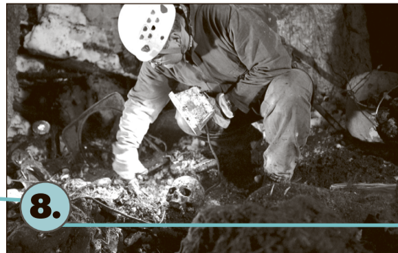
Ostaci žrtava genocida pronađeni su na nekoliko lokacija, u primarnim, sekundarnim i tercijarnim masovnim grobnicama.

Uz pomoć istražitelja iz MKSJ-a u Hagu Međunarodna komisija za nestale osobe je uspjela otkriti,