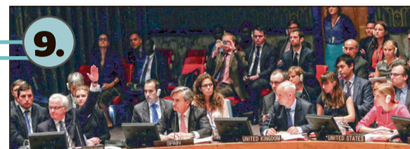
Stalni ambasador Sjedinjenih Država pri UN Samantha Power (D), stalni ambasador Rusije pri UN Vitaliy Curkin (L), stalni ambasador Španije pri UN Oyarzun Marchesi (L2), stalni ambasador Velike Britanije pri UN Matthew Rycroft (D2) 8. jula 2015. prisustvuju sjednici Savjeta bezbjednosti u New Yorku povodom maskara u Srebrenici, kada Rusija ulaže veto na Rezoluciju o genocidu u Srebrenici.

Masovna ubistva i genocid nad Bošnjacima vlasti iz Republike Srpske su godinama poricale. I danas se genocid u Srebrenici još