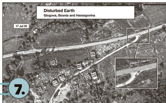
Glogova, snimci iz zraka

Tijela pogubljenih Bošnjaka bačena su u sakrivene masovne grobnice koje je iskopala vojska bosanskih Srba kako bi sakrila počinjene zločine. Ove masovne grobnice su poslije prekopavane i tijela su potom sklanjana u sekundarne i tercijarne masovne grobnice, ostavljajući mnoge ostatke rasparčanim i međusobno pomiješanim. Kako su