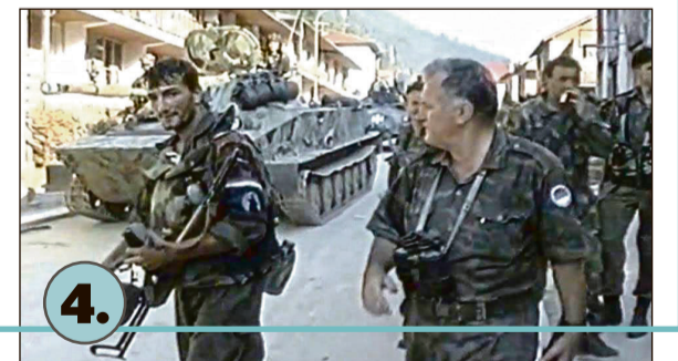
General VRS Ratko Mladić i vojnici bosanskih Srba ulaze u Srebrenicu 11. jula 1995, nekoliko sati prije početka prvih ubistava.

"...što prije izvršiti potpuno fizičko odvajanje Srebrenice od Žepe, čime će se spriječiti i pojedinačno